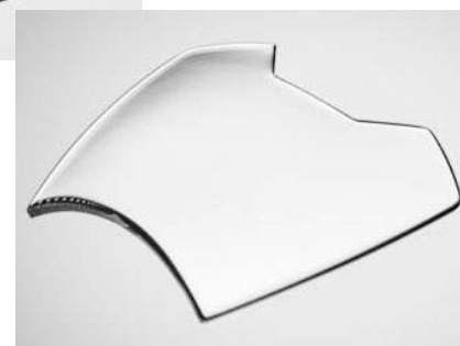
Fiche de suivi - Flux spécialités